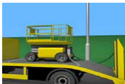
Figura 6. Amarres destensados.