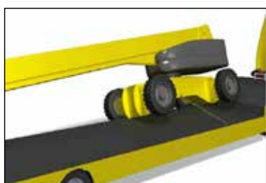
Figura 1. Desplazamiento de la PEMP sobre la plataforma de carga.