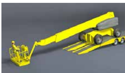
Figura 8. Golpe de la cesta contra el suelo.