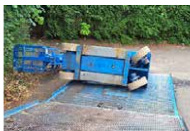
Figura 2. Vuelco de la PEMP durante la descarga.