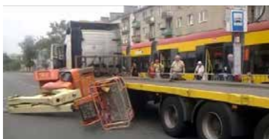
Figura 11. Caída de la PEMP durante la carga/descarga.