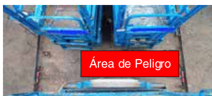
Figura 14. Zona de peligro de atrapamiento.