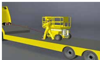
Figura 16. Uso del cabrestante para facilitar la carga o descarga.