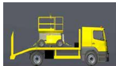
Figura 12. Carga recogida y amarrada correctamente.