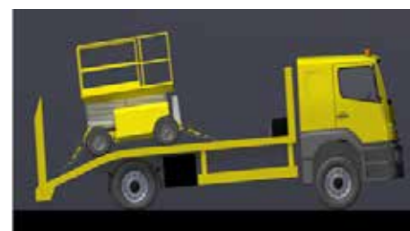
Figura 3. Sobrecarga eje trasero.