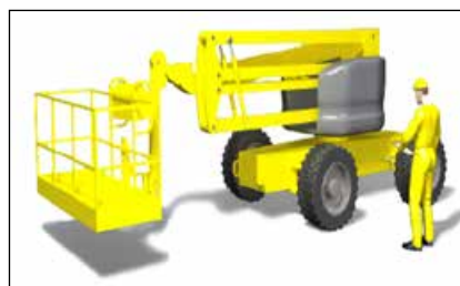
Figura 18. Comprobación del estado de la PEMP.