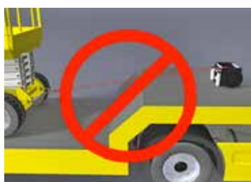
Figura 10. Utilizar el cabrestante como accesorio de amarre.