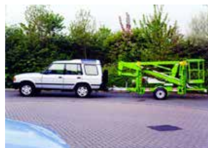
Figura 20. PEMP remolcable.

Según el artículo 25.1 del Reglamento General de Vehículos, los remolques y semirremolques no ligeros , es decir, aquéllos cuya masa máxima autorizada exceda de 750