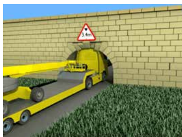
Figura 4. Choque contra un puente.