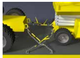
Figura 17. Carga correctamente asegurada.