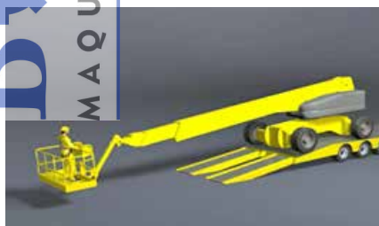
Figura 13. Descarga de la PEMP con la cesta lo más cerca posible del suelo.