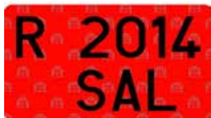
Figura 21. Placa de matrícula de PEMP, como remolque.

como las letras Ñ y Q, por su fácil confusión con la letra N y el número 0, respectivamente, y las letras CH y LL, por incompatibilidad con el diseño de la placa de matrícula que no admitiría la consignación de cuatro caracteres en el último grupo. Ver figura 21.