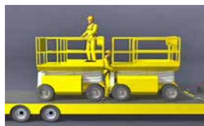
Figura 7. Atrapamiento entre PEMP.