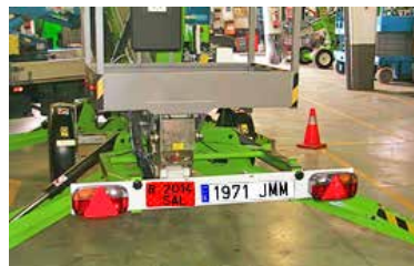
Figura 23. Sistema de señalización luminosa trasera.