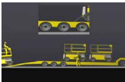
Figura 5. Sobrecarga de ejes durante la descarga de cargas mixtas.