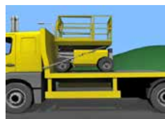
Figura 9. Golpe de la PEMP contra la cabina del vehículo.